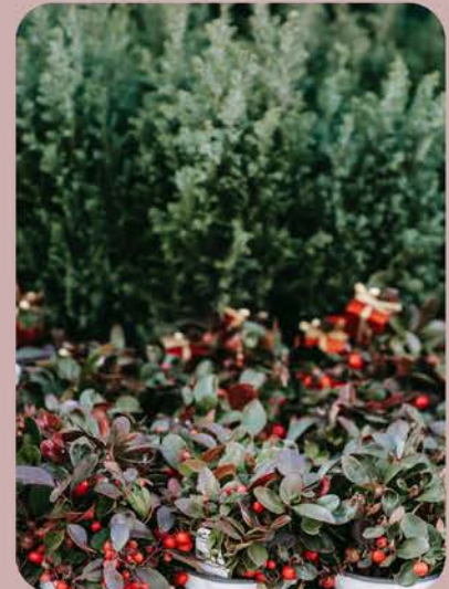
Winterharde actuele bloeiers