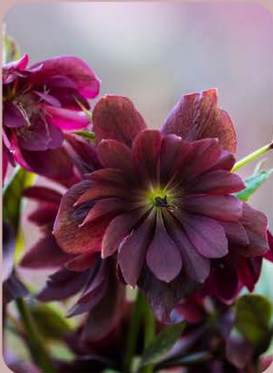
Vaste planten, grassen, bodembedekkers